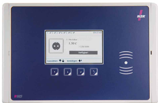
Abbildung: Großes Gehäuse